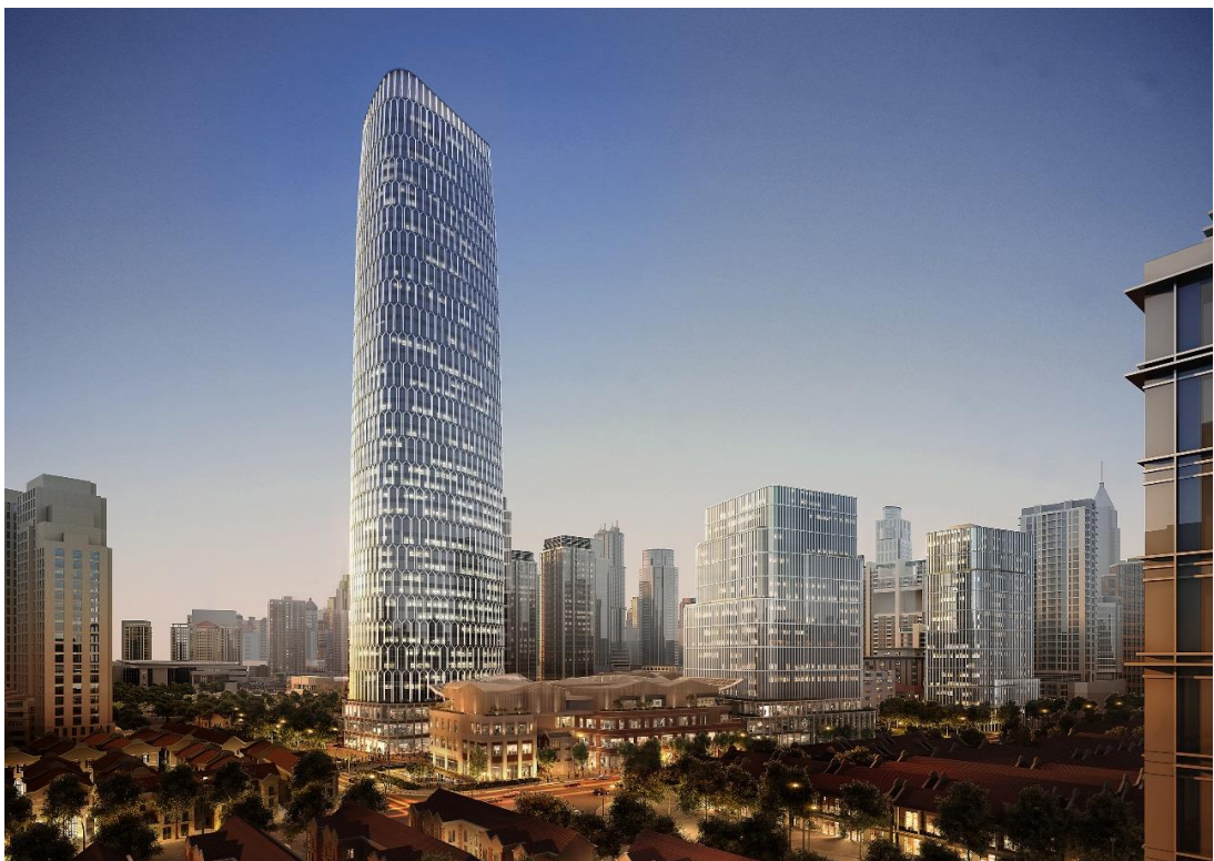
(太平洋新天地商业中心全景效果图)

在“双碳”战略下，建筑的可持续运营发展已成为各界共识和趋势所在。“一大会址·新天地”绿色低碳社区已经成为上海唯一一个成熟商区的近零碳示范区，在此基础上，太平洋新天地商业中心将持续探索绿色低碳转型路径，目前三栋办公楼及裙房商业目标是取得 WELL、LEED 双重预认证及中国绿色建筑两星以上认证。其中，太平洋新天地 T1 大厦及太平洋新天地 T2 大厦目标是获得 LEED 铂金级、WELL 金级认证，T1 大厦同时还将取得中国绿色建筑三星级认证。更值得一提的是，太平洋新天地 T1 大厦塔冠将围绕绿色可持续的主题，打造上海城市的“碳中和对话中心”，承载商务会谈、展览展示、科技交流等内容，共同探索推动城市绿色低碳的可持续发展路径。