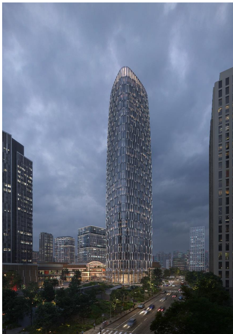
(太平洋新天地 T1 大厦效果图)

享有核心区位、通达四方绝佳地理位置的太平洋新天地 T1 大厦，是城市核心区内近年来稀缺的高端办公供应，步行距离即可到达周边 4 个地铁站，与轨道交通 1、8、10、13、14 号线融会贯通，毗邻南北高架路和延安高架路，10 分钟畅达各大核心商圈，实现高效出行。