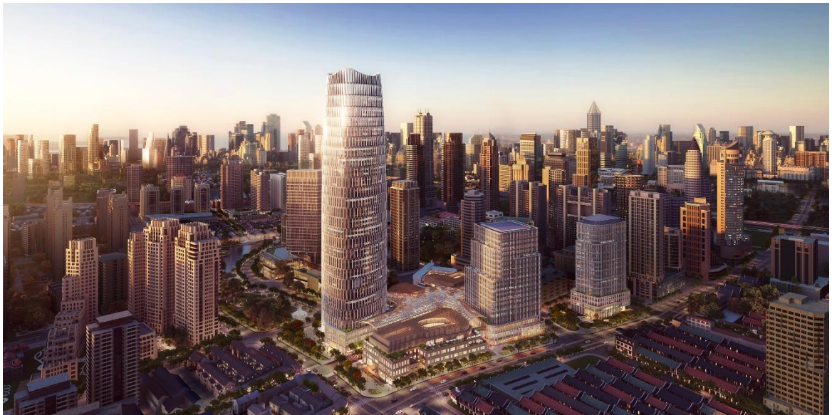
(太平洋新天地商业中心项目全景)

与新经济的龙头企业建立长期战略合作关系，汇集优质企业资源，实现重点产业的引入，为黄浦区带来产业聚集与人才吸引力的提升，从稳经济、促就业、引人才等多个层面实现城市高质量发展。