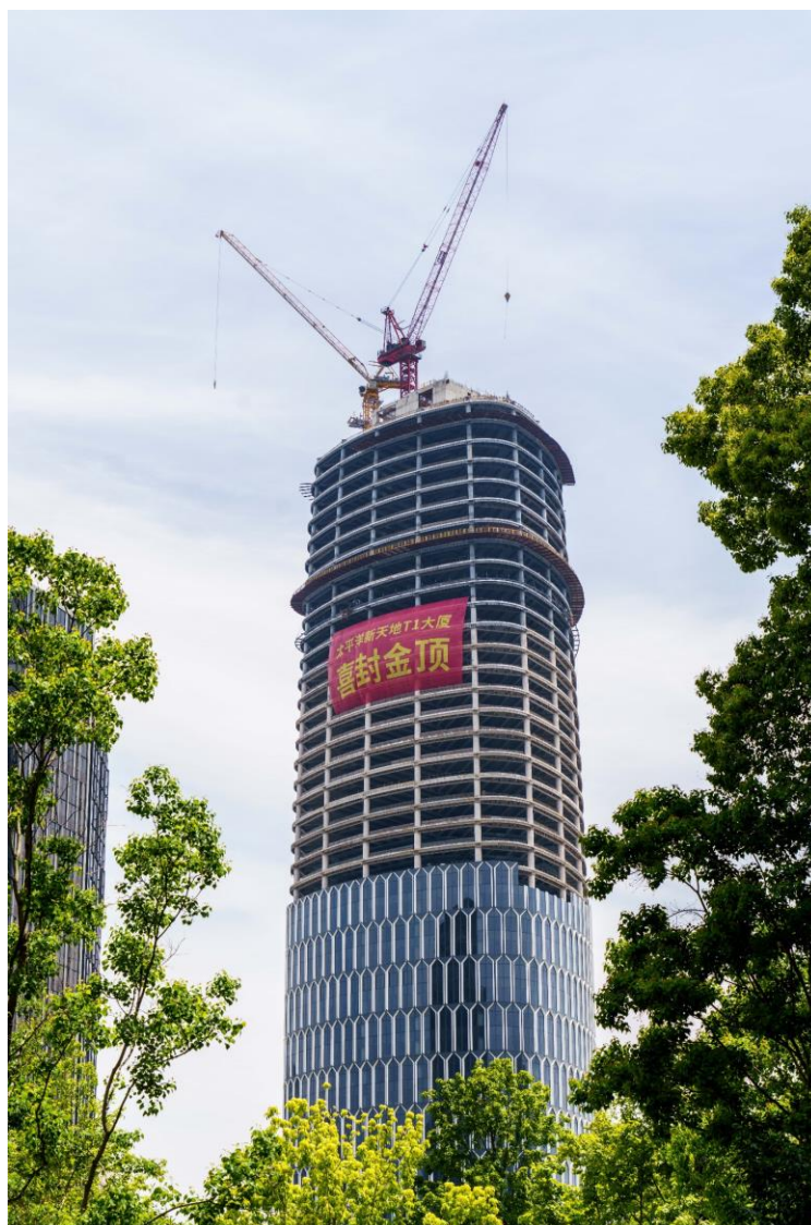
(太平洋新天地 T1 大厦喜封金顶)

太平洋新天地商业中心是由中国太保寿险、瑞安房地产与上海永业集团联合开发,项目建筑面积约 39 万平方米(含地上及地下),其中办公部分约 20 万平方米,商业部分约 8.3 万平方米。此次典礼上也首度公布了地块商办建筑体的分别命名: 250 米超高层超甲级写字楼命名为太平洋新天地 T1 大厦,两栋 100 米左右的甲级办公分别为太平洋新天地 T2 大厦和太平洋人寿大厦,裙房商业为太平洋新天地商业广场。