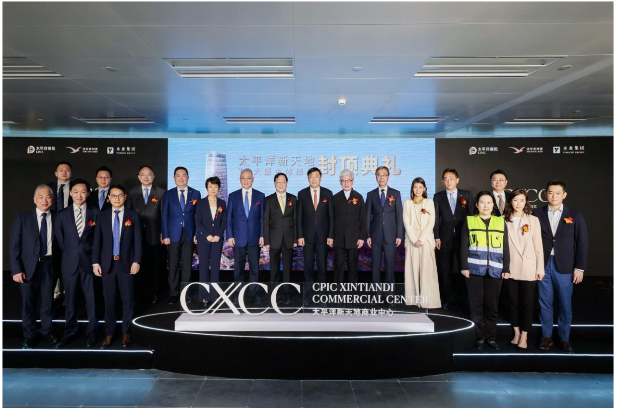
(太平洋新天地 T1 大厦封顶典礼现场)

中国太保集团、瑞安集团、永业集团、建工集团相关领导以及行业嘉宾共同见证了这一重要时刻。