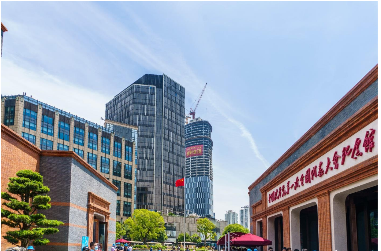
(大新天地区域实景图)

20 多年的发展，新天地不仅是上海的城市名片，更是全球二十大文化地标之一。上海在迈向全球卓越城市愿景下，未来的大新天地区域必将成为黄浦区“一带双核三区”新蓝图中“双核”的重要组成部分，通过打造城市活力空间，构建品质生活社区，引入丰富的文化艺术差异化体验并带来充满活力的社群体系，实现海派生活文化的复兴，成为“世界级复合功能核心区”的最佳实践。