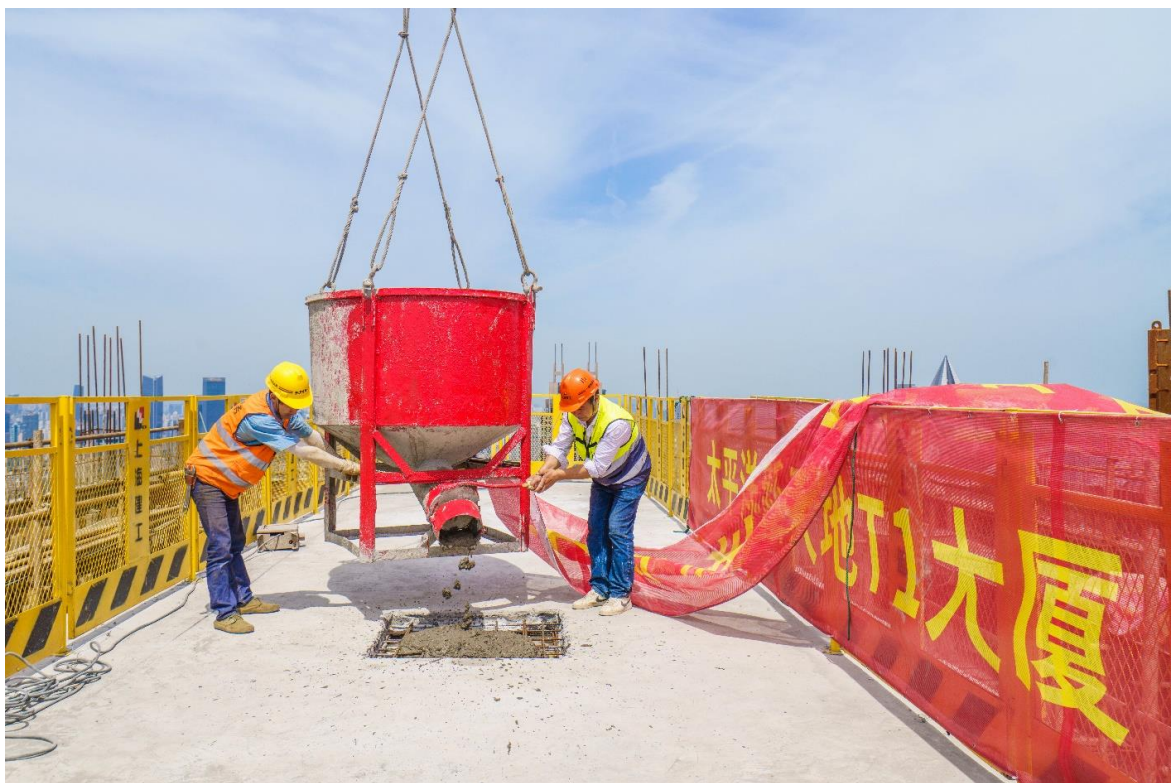
(太平洋新天地 T1 大厦封顶现场)

随着最后一方混凝土浇筑到位,250 米层高的太平洋新天地 T1 大厦的主体结构喜封金顶,成为上海核心区极具稀缺性的商务办公封面级作品。围绕太平湖,太平洋新天地 T1 大厦与两栋 100 米的双子楼与板块内已建商办项目的建筑高度自淮海路向西藏路一路递增至 250 米,形成多层次而有序的天际线,勾勒出新天地整体城市形象,赋予了上海具有复合功能的城市都心区的地标意义。