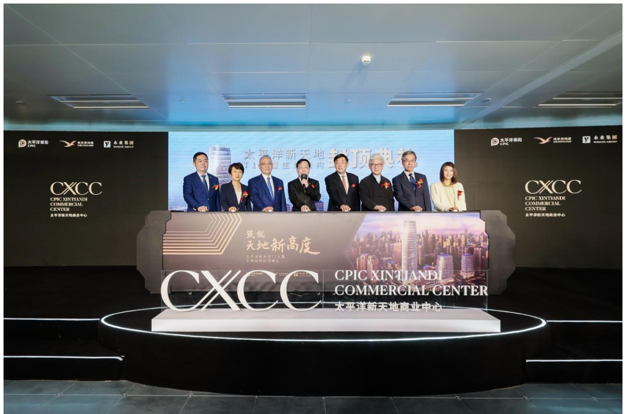
(太平洋新天地 T1 大厦主体结构封顶典礼启动仪式)

5月18日，太平洋新天地商业中心250米超高层超甲级写字楼——太平洋新天地 T1 大厦主体喜迎结构封顶，标志着新天地版图中面向未来的重要商业项目主体落地，将助力上海核心区商务办公的供应量与区域能级加速提升。